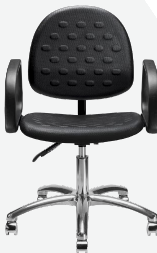
1952 BC ESD