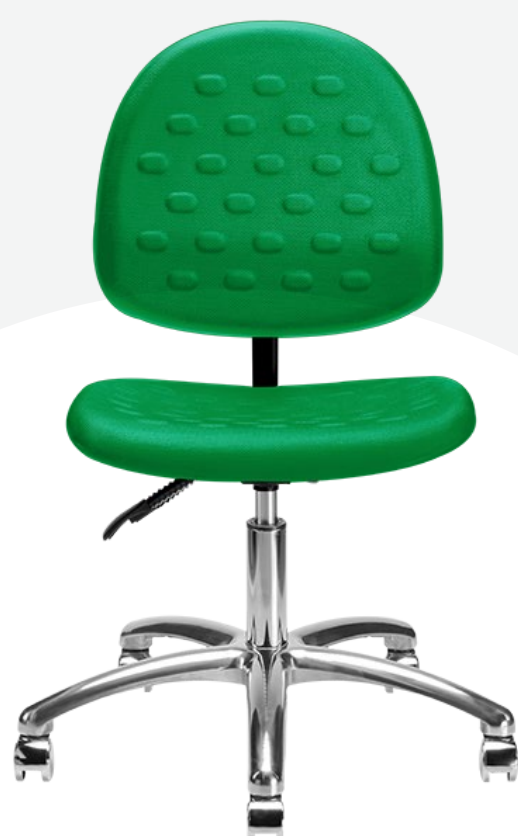
1952 B ESD