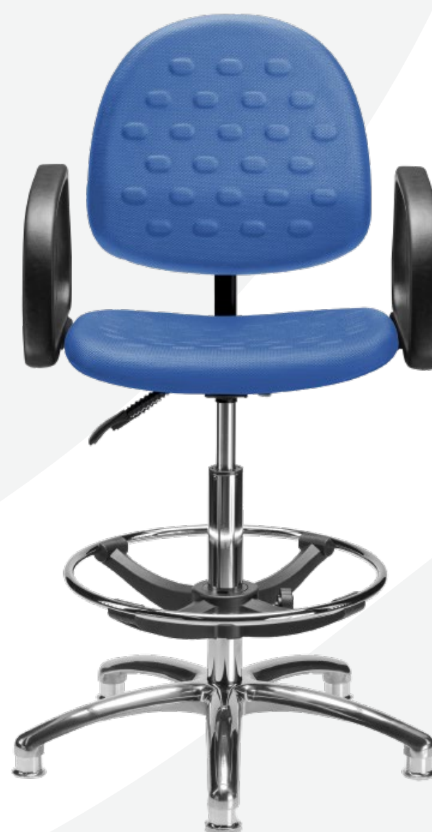
1952 AC ESD

Disponibles en gris, negro, azul, rojo, naranja o verde , a elegir.